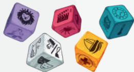
10 уникальных кубиков (по 2 каждого цвета)