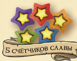
5 СЧЁТЧИКОВ СЛАВЫ