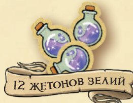
12 ЖЕТОНОВ ЗЕЛИЙ