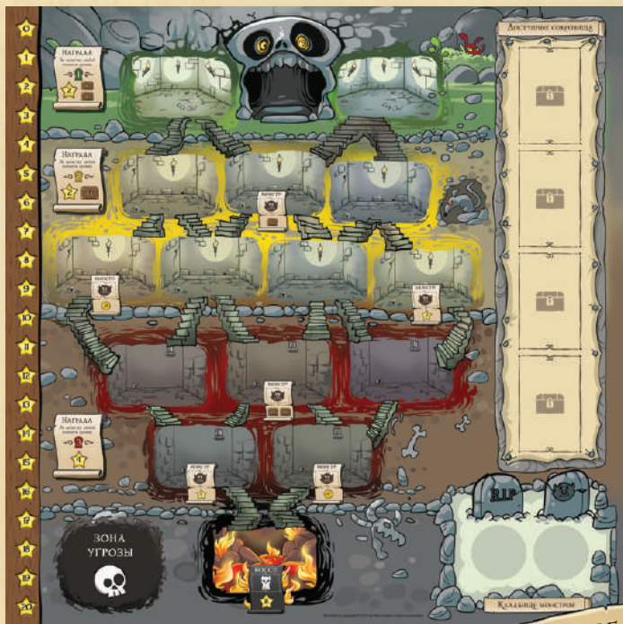
1 ИГРОВОЕ ПОЛЕ