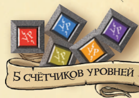
5 СЧЁТЧИКОВ УРОВНЕЙ