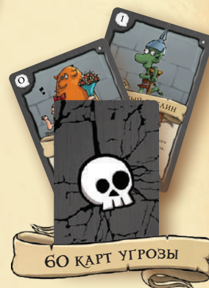
60 КАРТ УГРОЗЫ