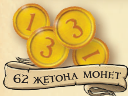
62 ЖЕТОНА МОНЕТ