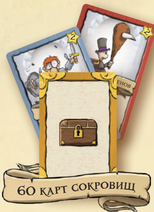
60 КАРТ СОКРОВИЩ