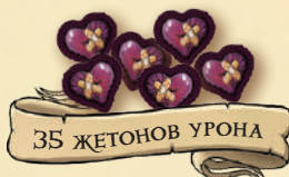
35 ЖЕТОНОВ УРОНА