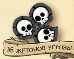
16 ЖЕТОНОВ УГРОЗЫ