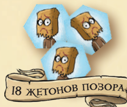
18 ЖЕТОНОВ ПОЗОРА