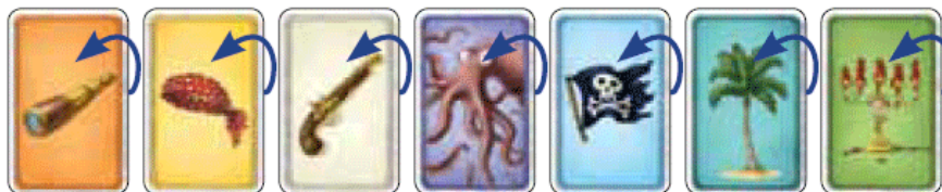
Рисунок 2: Разложите на столе в ряд лицевой стороной вверх 7 тематических карт. Затем положите лицевой стороной вверх по одной случайной пиратской карте под каждую тематическую карту так, чтобы цвет пиратской карты совпадал с цветом

Разложите на столе лицевой стороной вверх 7 пиратских карт, запомните их и затем переверните!