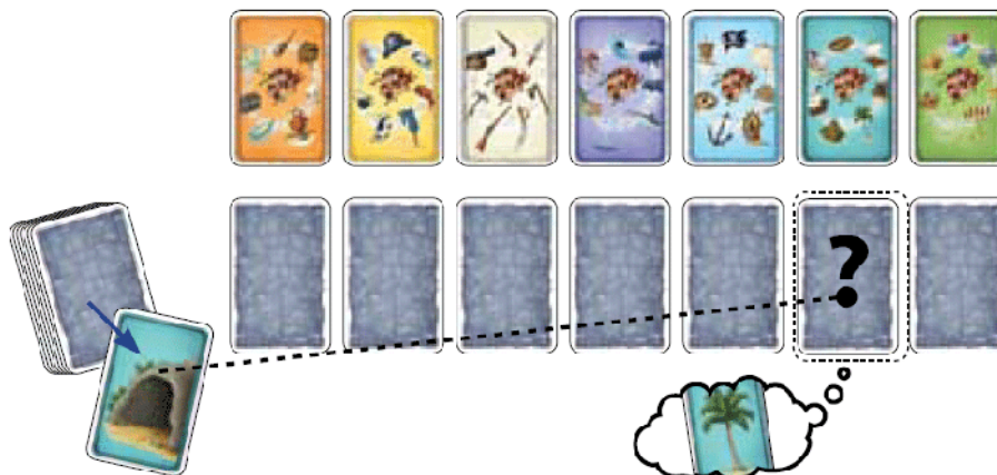
Рисунок 3: Верхней картой в колоде оказывается бирюзовая пиратская карта. Теперь вам нужно вспомнить, какой предмет изображён на пиратской карте, которая лежит лицевой стороной вниз под бирюзовой тематической картой. Игрок, первым крикнувший слово «пальма», кладёт карту с пальмой перед собой в качестве одного победного очка. После этого карта «грот» кладётся лицевой стороной вверх на место, где до этого лежала карта «пальма». Постарайтесь запомнить, что на ней изображён именно грот и затем переверните эту карту лицевой стороной вниз.

Игрок, который последним плывал на лодке, берёт колоду карт и открывает верхнюю карту так, чтобы все игроки одновременно увидели её лицевую сторону.