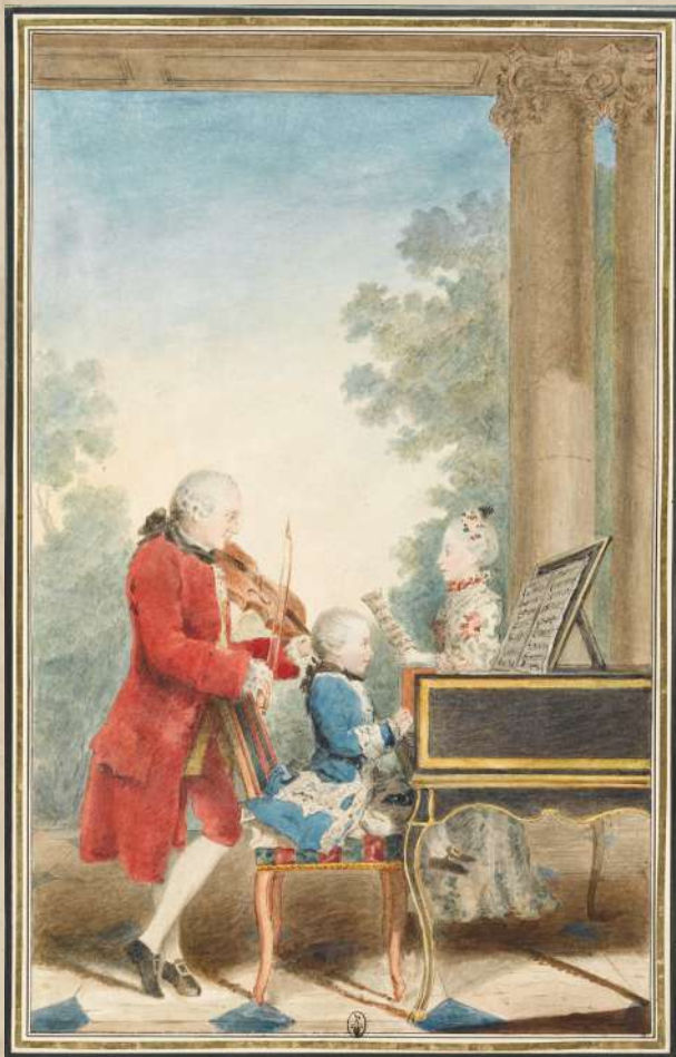
Леопольд, Вольфганг и Наннерль. Акварель Кармонтеля. 1763—1764. Париж

Творчество Моцарта начинается в раннем детстве с его отцом , но имени Леопольда мы в игре не увидим. Зато косвенно познакомимся с Марией Анной — она же Наннерль , старшая сестра Вольфганга и его главная соратница в музыкальном искусстве. Каждый игрок начинает партию с одной из страниц в нотной тетради Наннерль — эту тетрадь ей подарили на восьмилетие для упражнений в игре на фортепиано. Произведения туда вписывал отец — большинство он написал сам, но некоторые из них сочинил маленький Вольфганг.