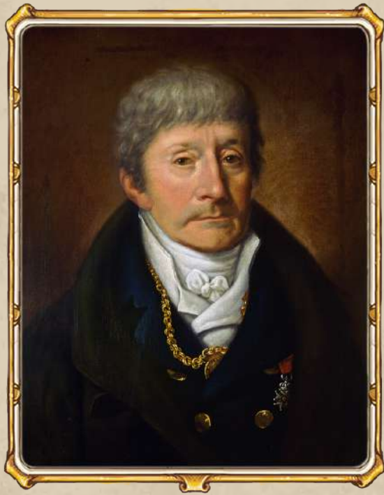
Антонио Сальери. Портрет работы Йозефа Виллиброрда Мелера

На оперном поприще композитор сталкивается с конкуренцией. Увлечённый работой над « Свадьбой Фигаро », Моцарт не уделяет достаточного внимания опере «Директор театра» — и проигрывает организованное императором состязание. Победу присуждают Антонио Сальери — его опера кажется публике более ёмкой.