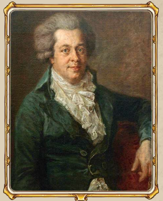
Последний прижизненный портрет Моцарта. Иоганн Георг Эдлингер. 1790. Мюнхен

Впоследствии его могилу отыскивали буквально чудом, и теперь на этом месте стоит памятник — плачущий ангел — с простой надписью: «Mozart».