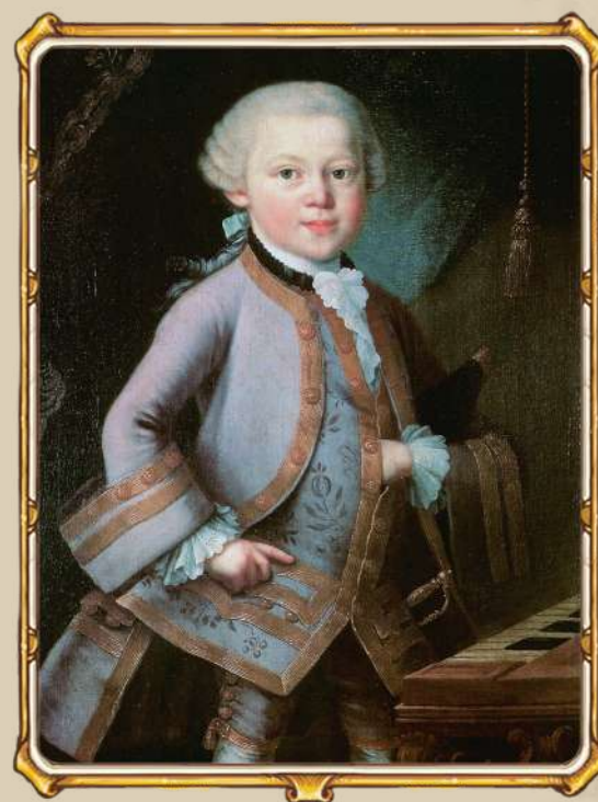
Шестилетний Моцарт. Портрет работы Леопольда Моцарта, его отца

А в 11 лет он сочинил свою первую оперу — произведение в жанре, который до сих пор считается самым сложным для любого взрослого композитора.