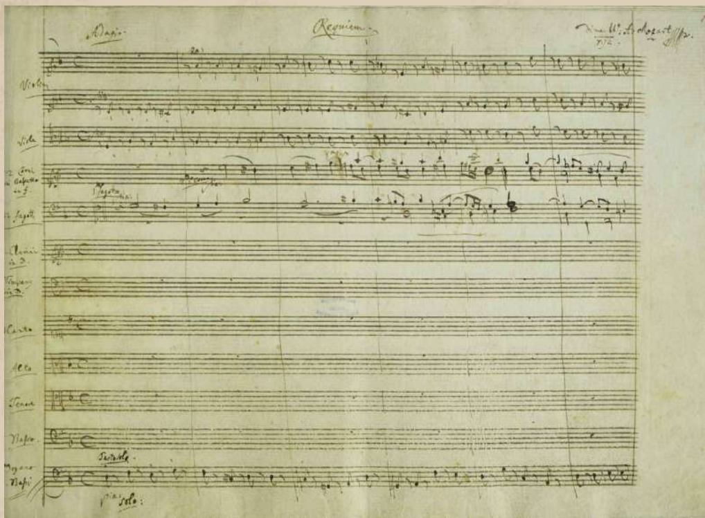
Первая страница партитуры Реквиема, рукопись Моцарта

Мы дошли до важной, пожалуй, даже главной части игры — это Реквием. Величайшее творение Моцарта. Незаконченное творение Моцарта.