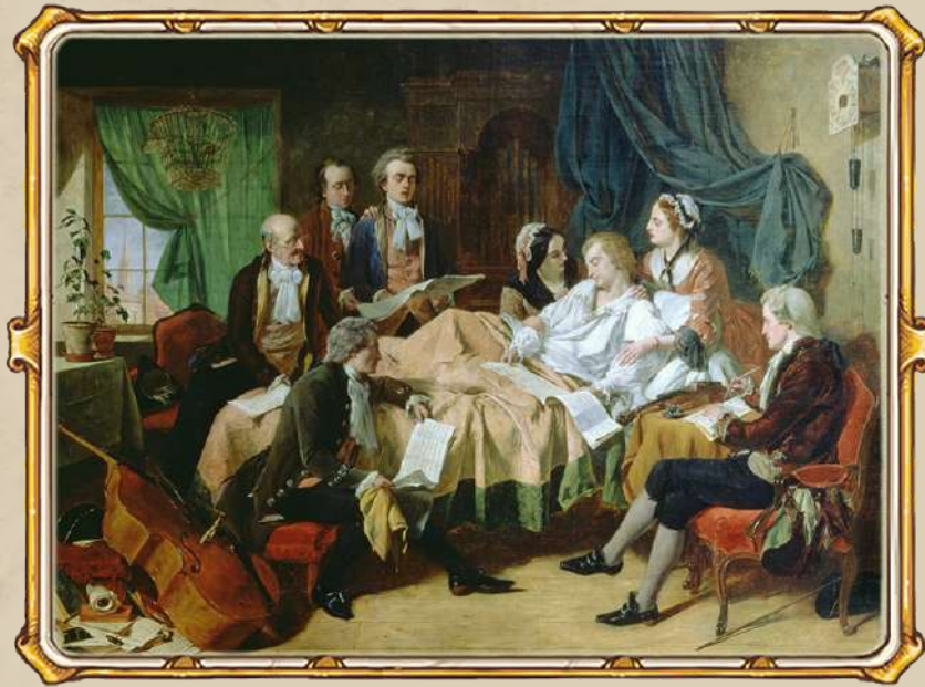
Последние часы жизни Моцарта. Генри Нельсон О'Нил. 1860-е

Констанция приезжает из Бадена и всячески ограждает Моцарта от работы — он очевидно болен. Более того, она буквально забирает Реквием у мужа и вызывает лучшего врача Вены. На время это помогает, и композитор даже находит в себе силы завершить другое произведение и продирижировать его исполнение 15 ноября.