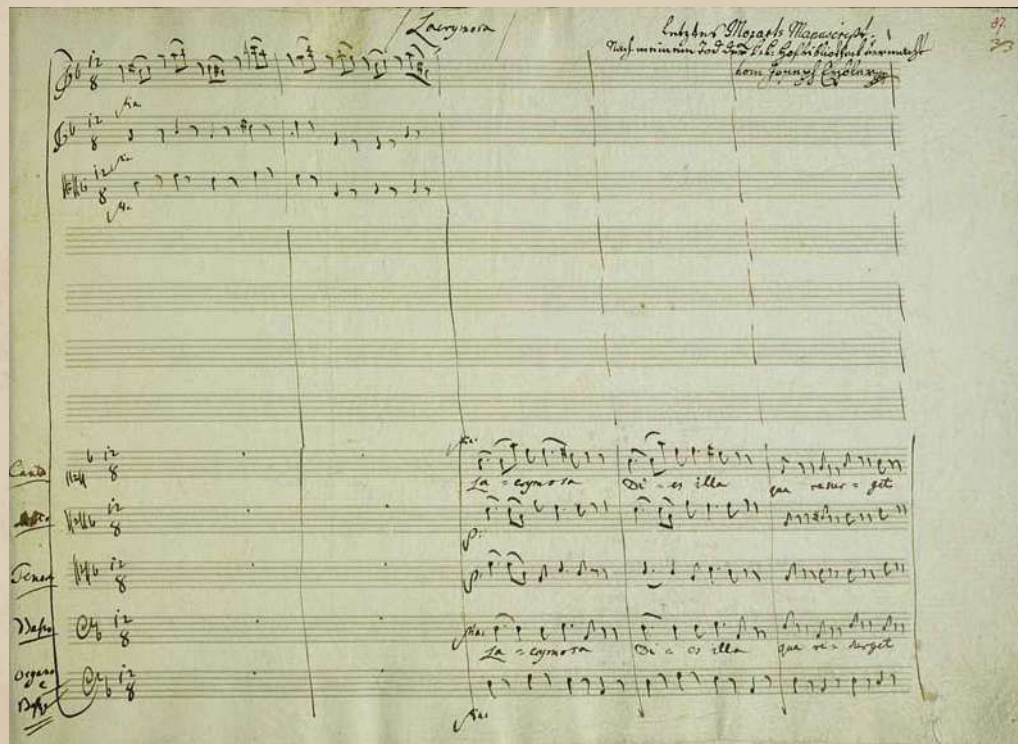
Рукопись Моцарта — та самая Lacrimosa

Констанция сама в итоге обращается к Зюсмайеру — всё-таки он уже помогал композитору с оркестровкой «Милосердия Тита». Он дописывает и оркеструет большую часть недописанных номеров, в том числе и Lacrimosa .