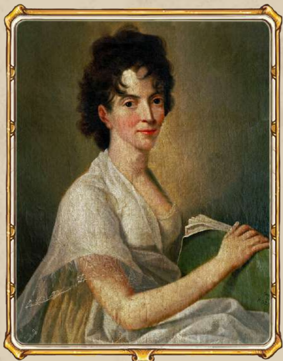
Констанция Моцарт. Портрет работы Ганса Хассена. 1802

На протяжении всей своей жизни Моцарт был окружён любящей семьёй, близкими друзьями и благодарными учениками. И это, разумеется, нашло своё отражение в Laetitia — в игре, а не в музыкальном произведении :)