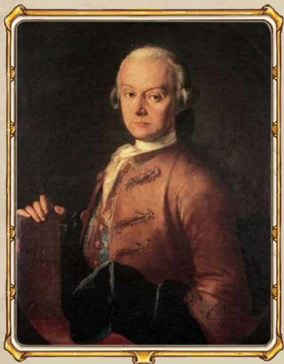
Леопольд Моцарт. Портрет работы Пьетро Антонио Лоренцони

Игра делится на пять раундов — эти раунды соответствуют пяти периодам, на которые можно условно разделить жизнь и творчество Моцарта. В каждом раунде — свои карты опусов, то есть произведений великого композитора, а также свои жетоны бонусов (о них мы кое-где поговорим чуть более подробно).