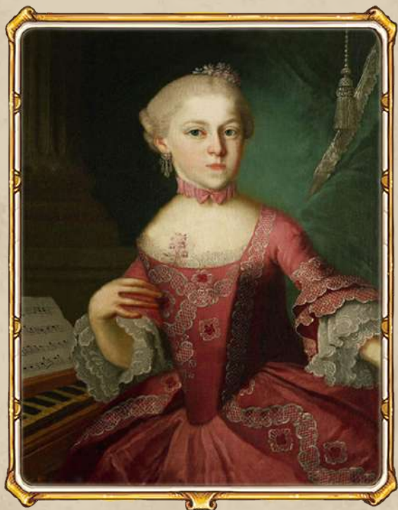
Мария Анна Моцарт в детстве. 1763

У Вольфганга была старшая сестра Мария Анна , которую все близкие звали Наннерль. Отношения у детей были прекрасные — они вместе росли и очень любили друг друга. В детстве Наннерль тоже была знаменитой исполнительницей, и они с братом нередко выступали дуэтом.