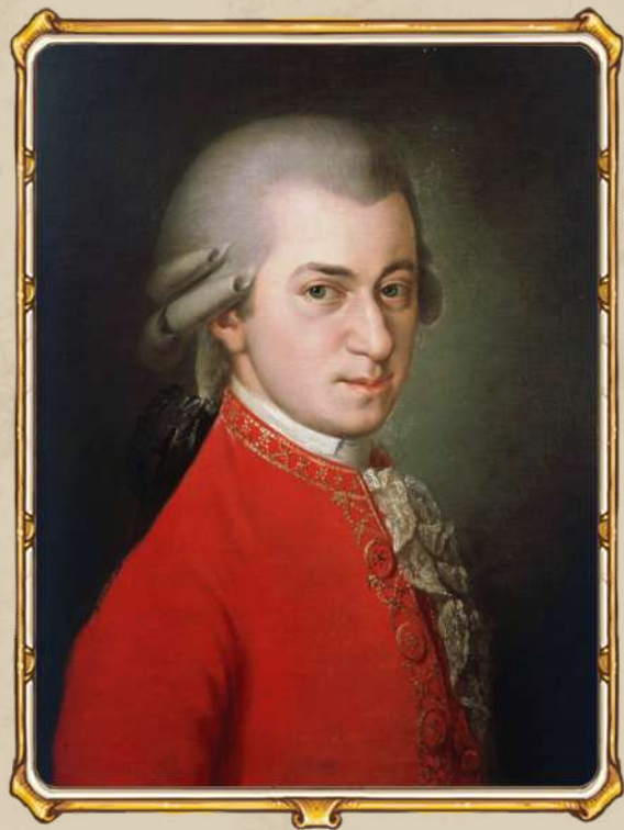
Посмертный портрет Моцарта работы Барбары Крафт (1819). Одно из самых известных изображений композитора

За свою недолгую жизнь — всего 35 лет! — Моцарт создал больше 620 произведений . Десятки сонат, месс, симфоний, концертов — перечислять можно бесконечно. Самое любопытное, что писал он их быстро и сразу начисто, и если вы решите сесть и просто переписать всего его произведения, то потратите на это больше времени, чем сам композитор — на их сочинение.