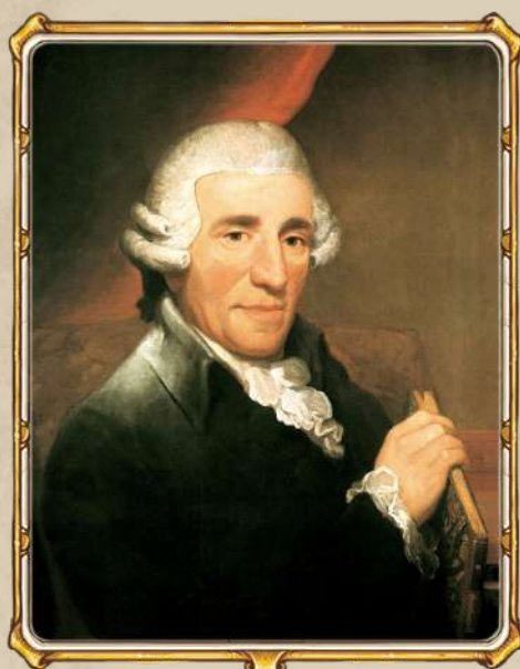
Йозеф Гайдн. Портрет работы Томаса Харди. 1792

А ещё это период смелых экспериментов , новаторства и поистине фантастических успехов . Моцарт богат, Моцарт знаменит, Моцарт получает огромные гонорары за концерты и издание собственных сочинений, он живёт в шикарной квартире, держит прислугу и, конечно, сочиняет музыку. Его камерные произведения пользуются небывалым успехом.