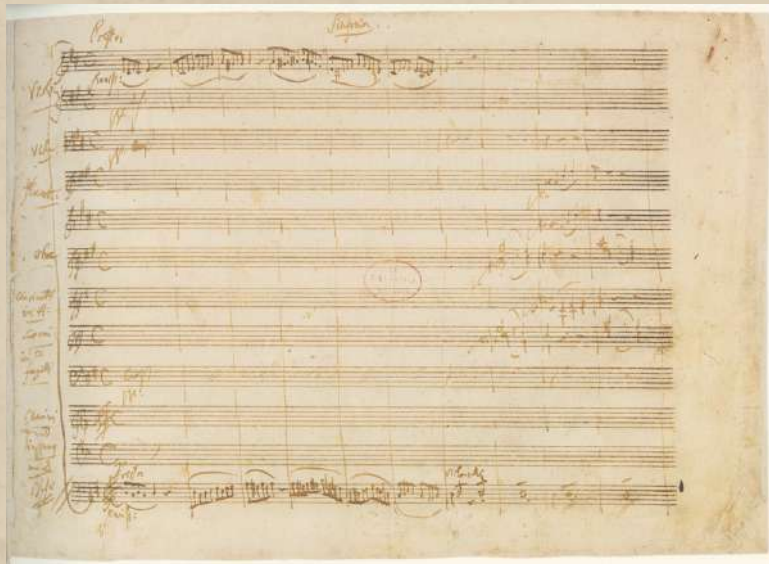
Первая страница увертюры «Женитьбы Фигаро». Автограф Моцарта

На самом деле Сальери перешёл дорогу Моцарту даже раньше, ещё в 1781 году, когда император назначил его учителем музыки принцессы Елизаветы Вюртембергской, хотя именно Вольфганга горячо рекомендовал младший брат Иосифа II.