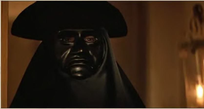
Кадр из фильма «Амадей»