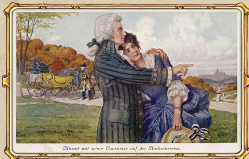
Моцарт и Констанция в медовый месяц. Открытка XIX века

Музыкальный фрагмент: «Идоменей», ария Электры из 3 действия