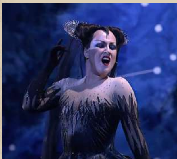
Диана Дамрау в образе Царицы Ночи