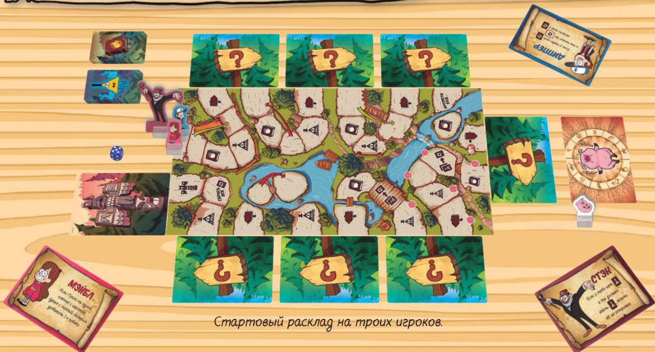
Стартовый расклад на троих игроков.