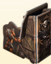
Готовая Осадная башня

И только хроника гномов повествует, как Ирлок, ужас из Таинственного моря, покинул шахту. Трудно себе представить, что когда-то могло существовать подобное существо. Но ныне никто не знает, что на самом деле произошло.