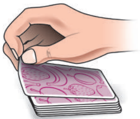
Рис. 1. Как переворачивать карту.

Переворачивать карту следует от себя, чтобы игрок, совершающий ход, увидел свою карту последним (см. рис. 1). Чем быстрее игрок откроет карту, тем быстрее он сам сможет увидеть её значение.